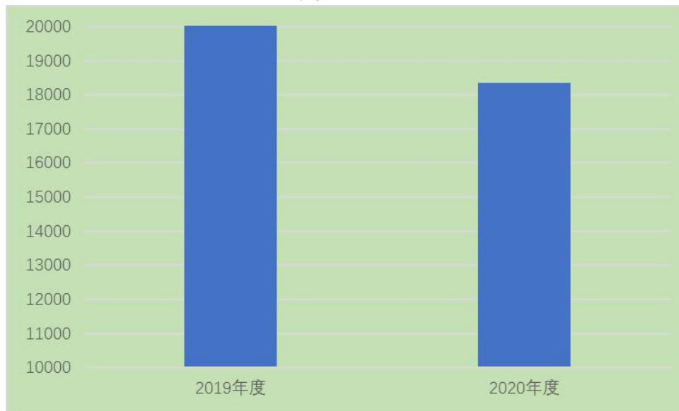
图1：收、支决算总计变动情况 (单位：万元)

2020年度收、支总计18,353.67万元。与2019年相比，收、支总计各减少2,275.56万元，减少11.03%。主要是财政拨款项目经费与上年相比有所减少。