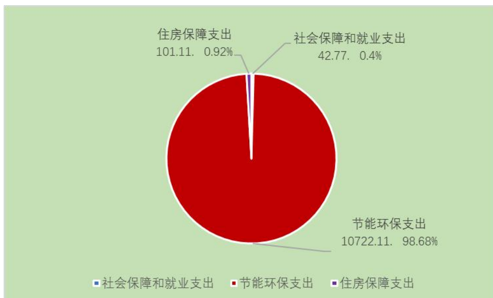
图6：财政拨款支出决算结构

(二) 财政拨款支出决算结构情况。2020年度财政拨款支出10,865.99万元，主要用于以下方面：社会保障和就业（类）支出42.77万元，占0.4%；节能环保（类）支出10,722.11万元，占98.68%；住房保障（类）支出101.11万元，占0.92%。